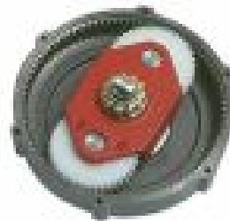
Dubbel planetaire overbrenging